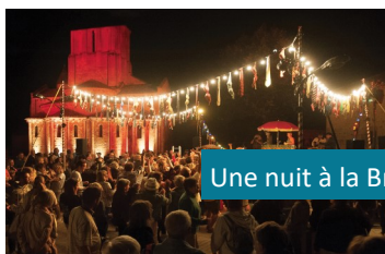
Une nuit à la Briqueterie

10 ème édition du festival Moul'Stock avec deux jours de festivités musicales dans une ambiance rock et moules-frites !