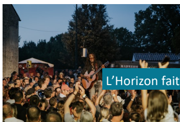
L'Horizon fait le mur

La Briqueterie ouvrira ses portes pour une grande soirée familiale sur le thème de la fête et des arts forains. Entresorts, manèges, spectacle, grand bal de clôture et feu d'artifice seront au programme de cette 8 ème édition du festival labellisé Sites en Scène par le Département de la Charente-Maritime !