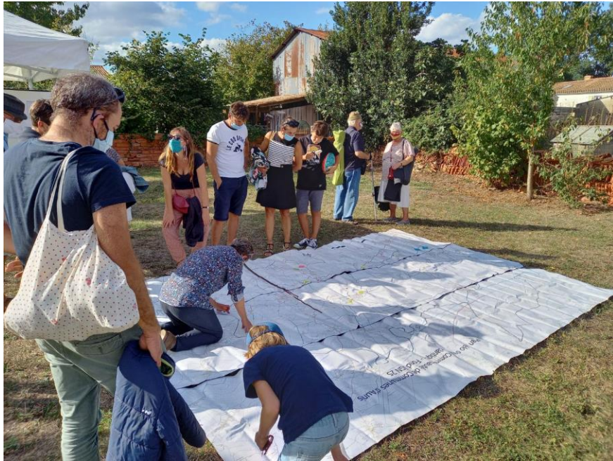
Atelier carte de Gulliver en 2020

Pour expliquer la reprise du Club Vélo en 2022, il a été rappelé que celui-ci existait déjà auparavant pour élaborer collectivement les futurs itinéraires cyclables en Aunis Atlantique. Ainsi, en 2020-2021, les habitants du territoire ont participé à divers ateliers de cartographie pour définir le potentiel et établir un diagnostic qui a ensuite été analysé par un bureau d'études. Ce travail collectif a permis d'aboutir à un Schéma Directeur Cyclable, document cadre pour la planification et l'élaboration de la politique cyclable du territoire pour les années à venir.