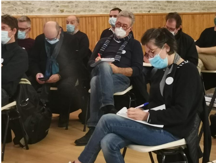
Club Vélo – 10 février 2022

Chacun des participants a eu l'occasion de se présenter en quelques minutes, pour expliquer ses motivations et ses attentes pour le Club Vélo. Ce moment d'échanges a également été l'occasion pour certains de préciser leurs pratiques cyclistes et de commencer à évoquer certains besoins qui se font ressentir sur le territoire pour favoriser l'usage du vélo comme mode de déplacement au quotidien. En réponse, des idées ont été proposées et il a été convenu que plusieurs aspects méritent d'être retravaillés collectivement.