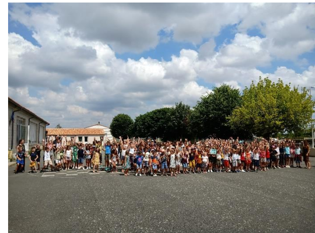
St Jean de Liversay,